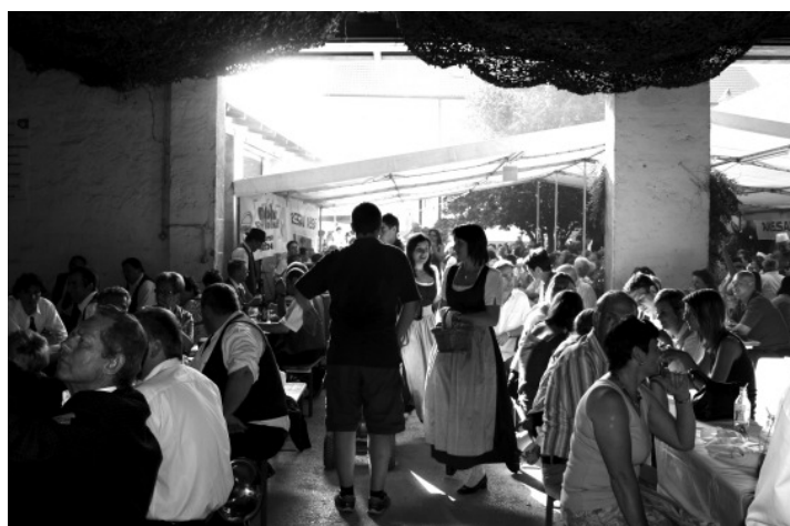
Während sich die Halle am Samstag nur zögerlich füllte, war am Sonntag jeder Platz besetzt.

Abend bei zünftigen Darbietungen der „Stallberg Musikanten“ ausklingen. In diesem Rahmen wurden auch die Ergebnisse der Bewertung bekannt gegeben: Die Stadtkapelle Wolkersdorf, die Stadtkapelle Mistelbach und der Musikverein Harmonia Großengersdorf konnten einen „Ausgezeichneten Erfolg“ erzielen. Die Trachtenkapelle Kreuttal freut sich über einen „Sehr guten Erfolg“.