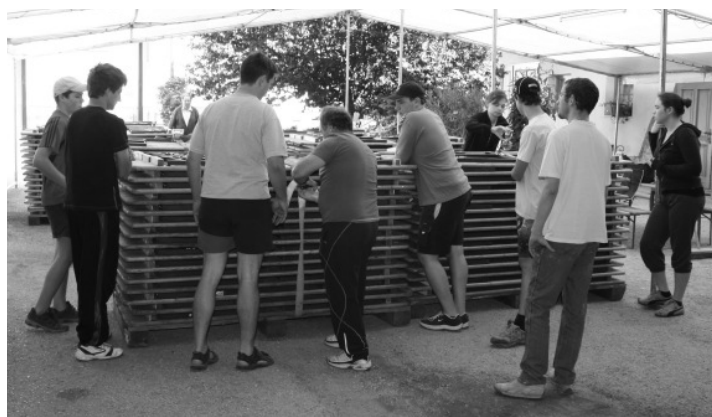
Für die Vorbereitungsarbeiten haben sich die Musikerinnen und Musiker sehr viel Zeit genommen.

Am Sonntag marschierten die Musikkapellen zum Wertungsspiel auf. Die Trachtenkapelle Kreuttal trat in der Stufe D an, in der eine große Wende während des Marschierens vorgesehen ist. Besondere Attraktionen boten die Trachtenkapelle Wilfersdorf und die Ortsmusik Pillichsdorf, die in der Stufe E eine Showeinlage präsentierten. Im Anschluss an die Bewertung zogen die Gäste in die Festhalle ein und ließen den