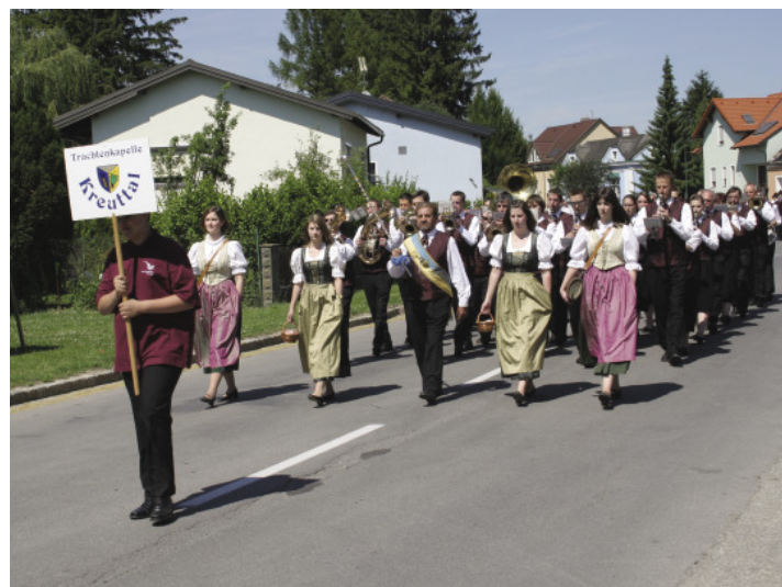
Bezirksmusikfest 2009: Die Trachtenkapelle Kreuttal trat bei der Marschmusikbewertung in Hautzendorf in der Stufe D an. Wie der Großteil der Kapellen erlangte sie einen „Sehr guten Erfolg“.

Wir freuen uns auf ein Wiedersehen bei unseren Veranstaltungen und wünschen Ihnen und unseren Musikerinnen und Musikern erholsame Sommermonate!